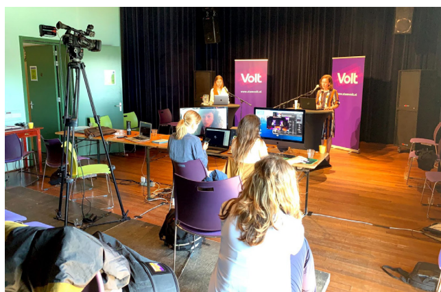
Links: Congres 6 juni. Rechts: Beleidscongres 20 juni.