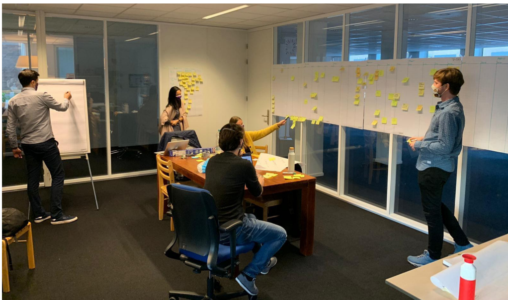
Campagnestrategie-sessie op het kantoor in Utrecht.

Ook startte de eerste grote campagne-actie onder leiding van het fundraising team. Het idee was om de kleine 2.000 leden die Volt op dat moment telde te bellen om hen te activeren en te kijken of zij wilden bijdragen aan de campagne-begroting. Zo heeft de belsquad bestaande uit ruim 50 Volters in twee weken alle leden opgebeld, een enorme prestatie. We bedanken Thijs Schaap, het fundraising team, lokale teams, alle leden en vrijwilligers die gebeld of gedoneerd hebben enorm.