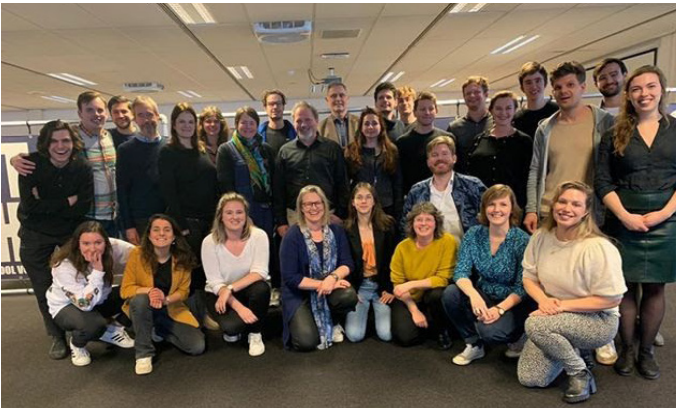
Run for Volt-groep tijdens het laatste trainingsweekend in maart.

In deze maand eindigde ook fase 1 van het beleidsproces met als resultaat meer dan dertig lokale thema-avonden en -middagen en veel input voor beleid. Dit legde een stevig fundament voor de start met fase 2: input verwerken tot een voorstel. Tijdens deze fase heeft het beleidsteam met experts gesproken en de input getoetst en aangevuld.