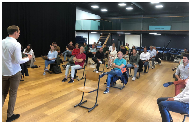
Volt Summer School met de City Leads

Na een enorm drukke periode met betrekking tot beleid en het selectieproces van de top 6-kandidaten stond de maand juli ook in het teken van de zomer. Een goed moment om even een stap achteruit te doen en ook even te relaxen.