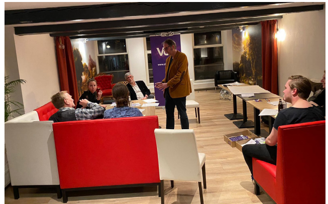
Links en rechts: Tour d'Hollande, lokale thema-avond in Groningen.