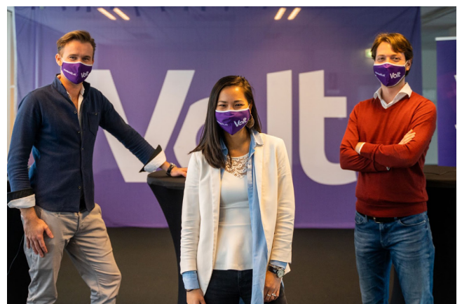
Links: Gekozen kandidaten tijdens het congres van 24 oktober.