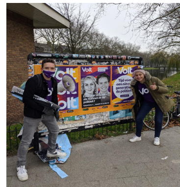
Links: Posters plakken in Amsterdam. Midden: Posters plakken Groningen. Rechts: Posters plakken Rotterdam.