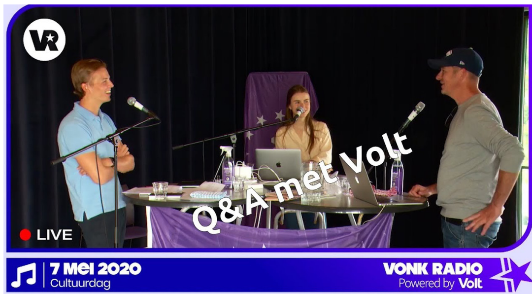
De Vonk Radio studio