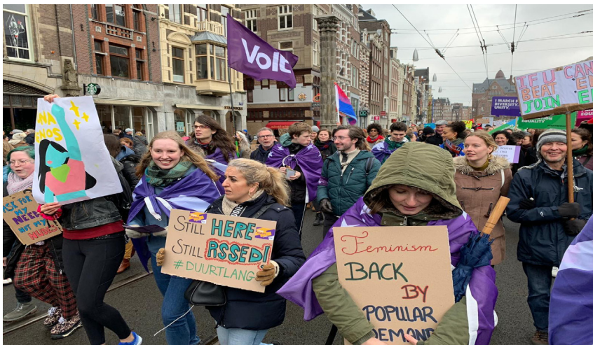
Vrouwenmars in Amsterdam.

Naast het organiseren van evenementen voor Volters en geïnteresseerden van Volt, sloten we ons ook massaal aan bij extern georganiseerde evenementen. Zo deed Volt mee aan de vrouwenmars in maart, hebben Volters meegedaan aan verschillende klimaatmarsen, waren we aanwezig bij een demonstratie voor de vluchtelingen op Lesbos en liepen we mee tijdens de Human Rights Walk om 500 kinderen van Moria welkom te heten in Nederland. Tijdens de verschillende demonstraties hielden Volters zich ten alle tijde aan de richtlijnen van de Rijksoverheid.