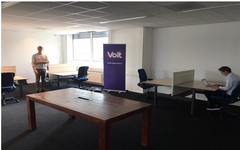
Nieuw kantoor in Utrecht

Daarnaast verhuisde Volt Nederland van een plek naast Utrecht Centraal naar een eigen kantoorruimte in Utrecht via Stichting LOU.